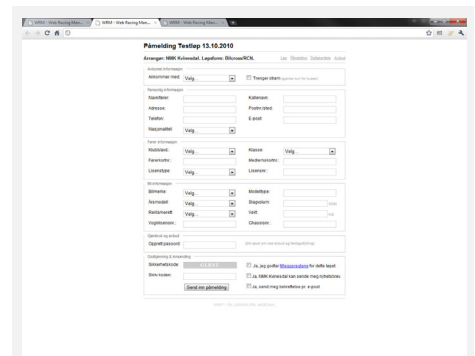
Påmeldingsskjema for deltakere i WRM.