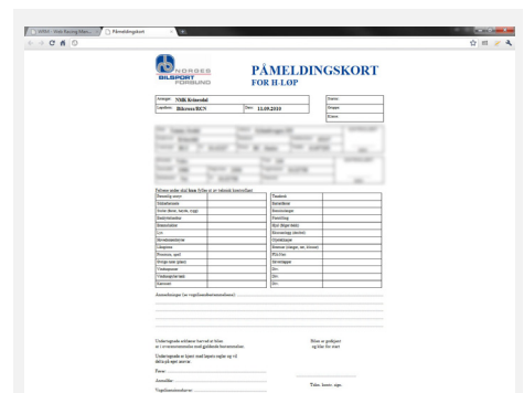
Automatisk genererte påmeldingskort i WRM.